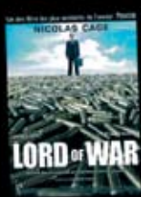
El senyor de la guerra

Amb l'exposició 'Cinema i pau' i les fitxes didàctiques que l'acompanyen, us proposem, a través del cinema actual, una aproximació i reflexió a l'entorn d'aquesta problemàtica.