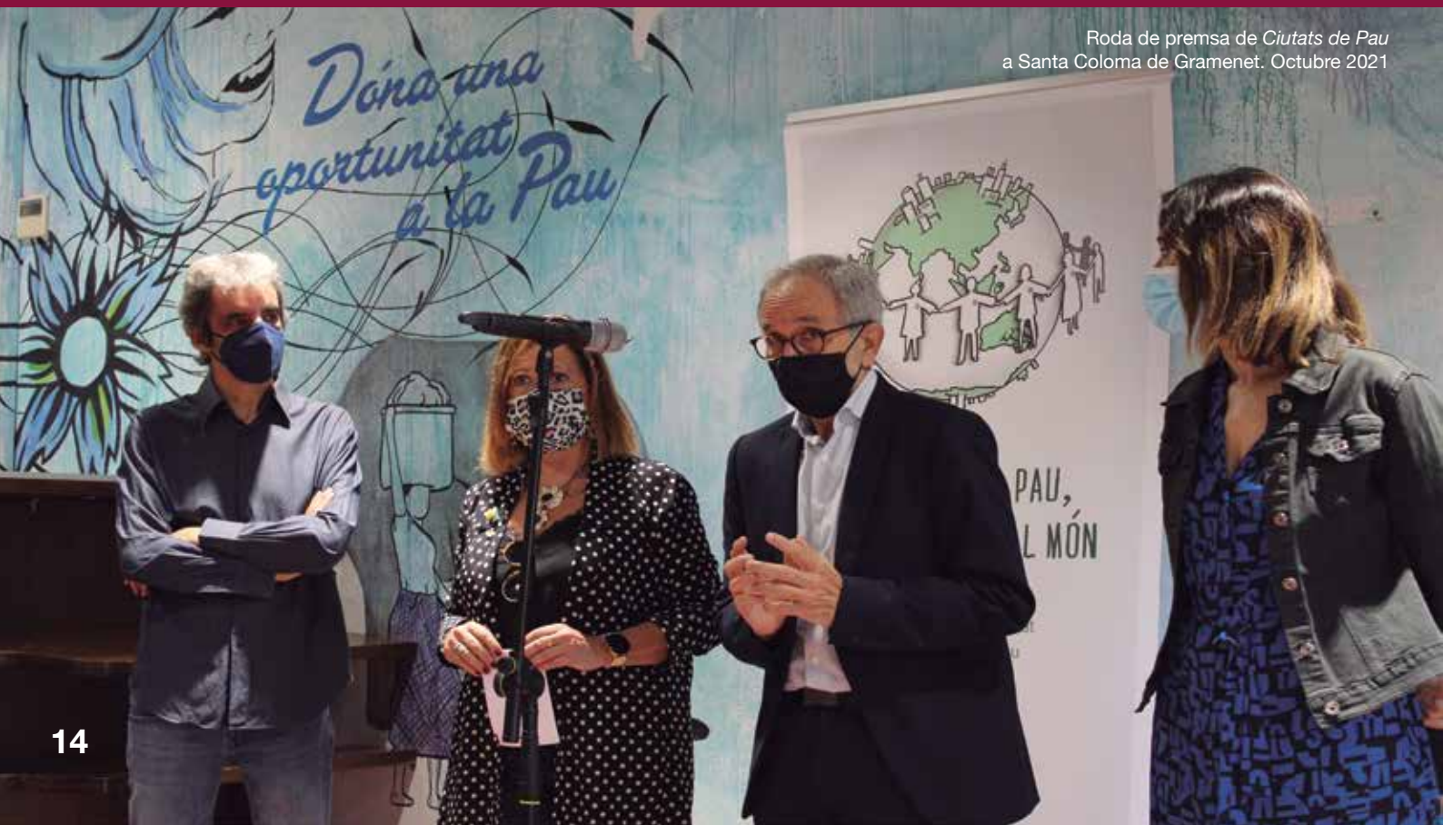
Roda de premsa de Ciutats de Pau a Santa Coloma de Gramenet. Octubre 2021