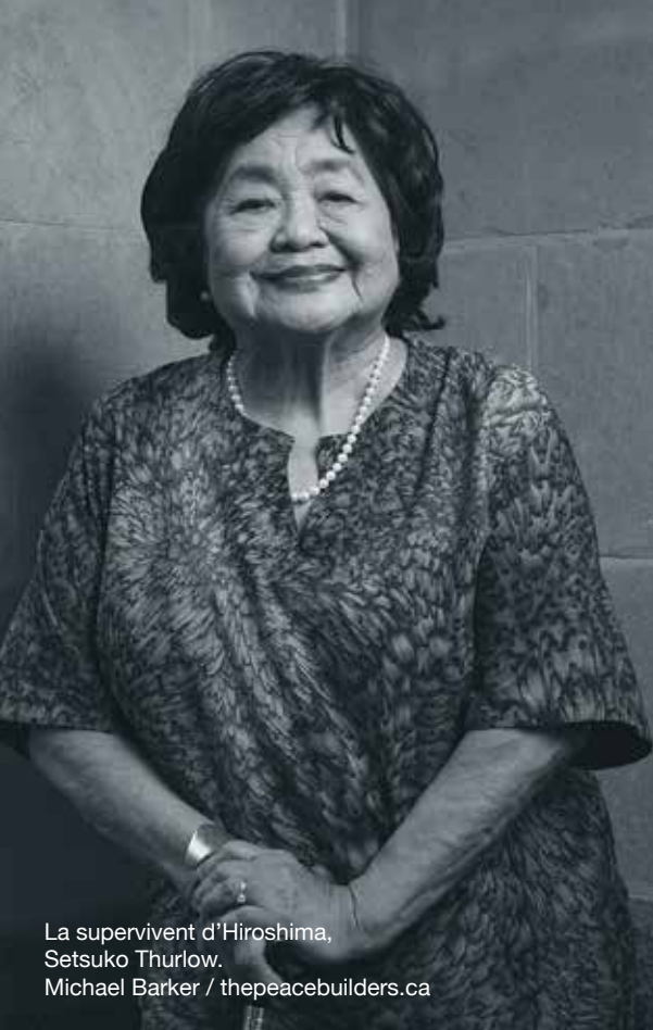
La supervivent d'Hiroshima, Setsuko Thurlow.

“LES ARMES NUCLEARS SEM- PRE HAN SIGUT IMMORALS. ARA TAMBÉ SÓN IL-LEGALS”