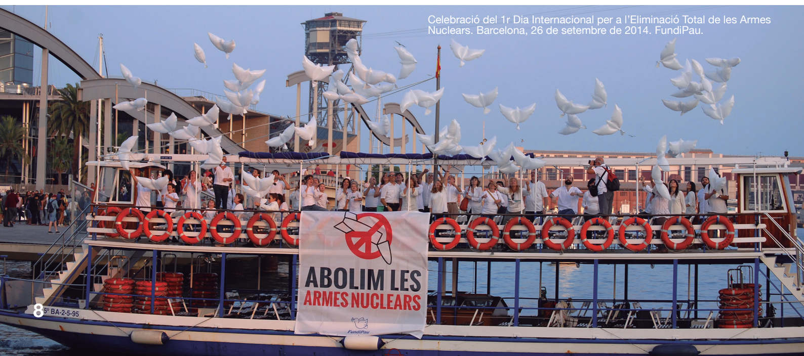
Celebració del 1r Dia Internacional per a l'Eliminació Total de les Armes Nuclears. Barcelona, 26 de setembre de 2014. FundiPau.

En el marc de la commemoració del 70è aniversari de les bombes d'Hiroshima i Nagasaki l'agost de 1945, FundiPau llança una ciberacció per demanar el suport de la ciutadania a l'abolició de les armes nuclears. Més de cinc-centes persones, entre les quals representants polítics, periodistes, activistes i personalitats del món de la cultura, se sumen a la iniciativa.