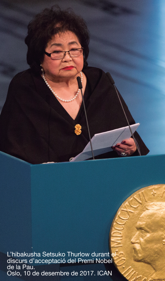
L'hibakusha Setsuko Thurlow durant el discurs d'acceptació del Premi Nobel de la Pau. Oslo, 10 de desembre de 2017.

“DIRIGENTS DELS PAÏSOS DE TOT EL MÓN, US HO PREGO: SI ESTIMEU AQUEST PLANETA, SIGNEU AQUEST TRACTAT.”