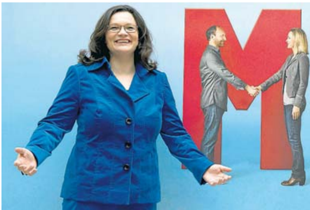
La ministra alemanya de Treball i Afers Socials, Andrea Nahles (SPD), presentant l'esborrany de la llei que fixa el salari mínim per hora en 8,5 euros.