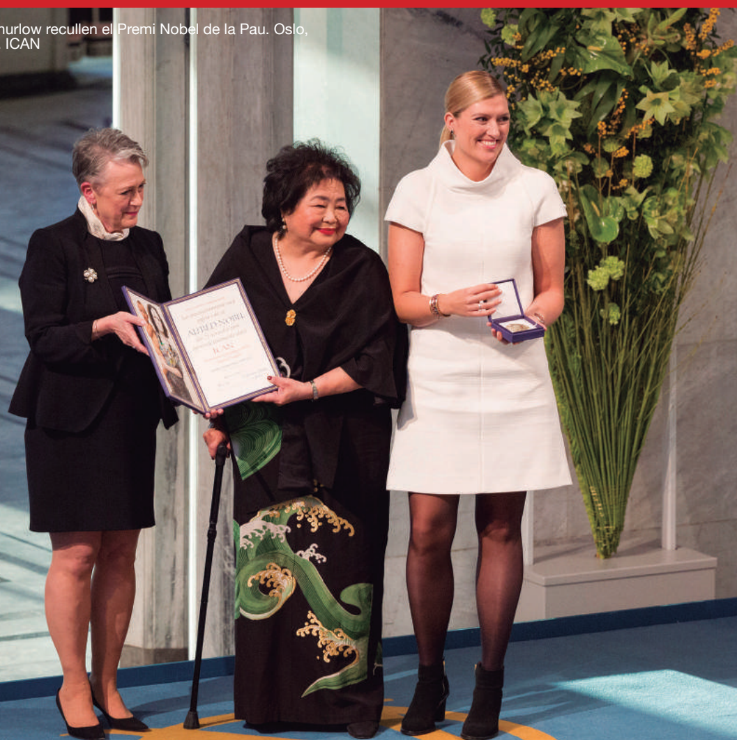
Beatrice Fihn i Setsuko Thurlow recullen el Premi Nobel de la Pau. Oslo, 10 de desembre de 2017.

nuclears i en els pròxims anys potenciarà el missatge de la mentre persevera en la tasca per garantir la plena aplicació d’aquest nou acord històric. Qualsevol país que vulgui un món més pacífic, per sempre lliure de l’amenaça nuclear, firmarà i ratificarà el tractat sense tardança.