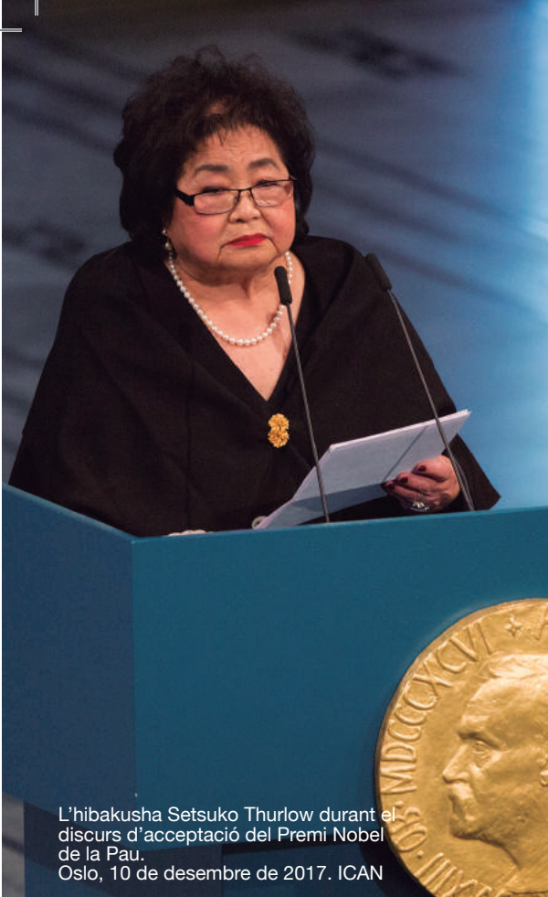
L'hibakusha Setsuko Thurlow durant el discurs d'acceptació del Premi Nobel de la Pau. Oslo, 10 de desembre de 2017.

“DIRIGENTS DELS PAÏSOS DE TOT EL MÓN, US HO PREGO: SI ESTIMEU AQUEST PLANETA, SIGNEU AQUEST TRACTAT.”