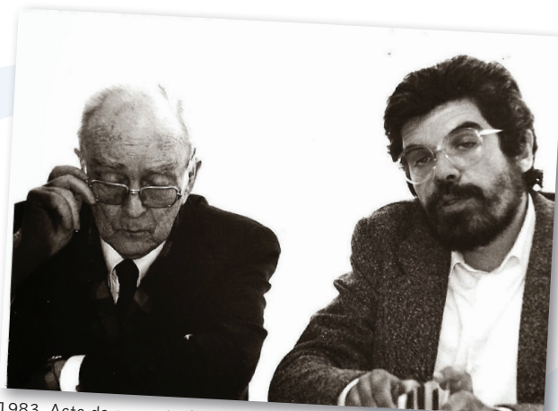
1983. Acte de presentació de la Fundació per la Pau , amb Sean McBride

1996 - Únicament una adequada comprensió i una intel·ligent i coratjosa gestió de la complexitat pot conduir a solucions constructives, les úniques que són solucions, als grans reptes que la justícia, la pau i el medi ambient ens plantegen en aquest fi de mil·lenni.