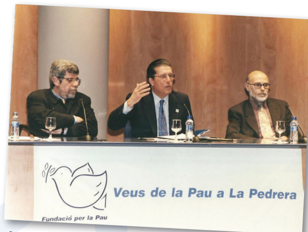
2000. Conferència Veus de Pau a la Pedrera , amb Federico Mayor Zaragoza i Fèlix Martí

2012 - Segueixo amb un compromís mantingut per la cultura de pau pel qual no m'ha faltat mai imaginació, ni m'han fallat les intuïcions, però en el qual sovint m'ha flaquejat el coratge. De tot plegat en queda un destil·lat: la pau és el camí, exigent, cap a una humanitat més justa i fraternal, i el perdó i la reconciliació, les actituds necessàries per trencar la cadena de causalitats que expliquen una història permanentment violenta que no volem continuar.