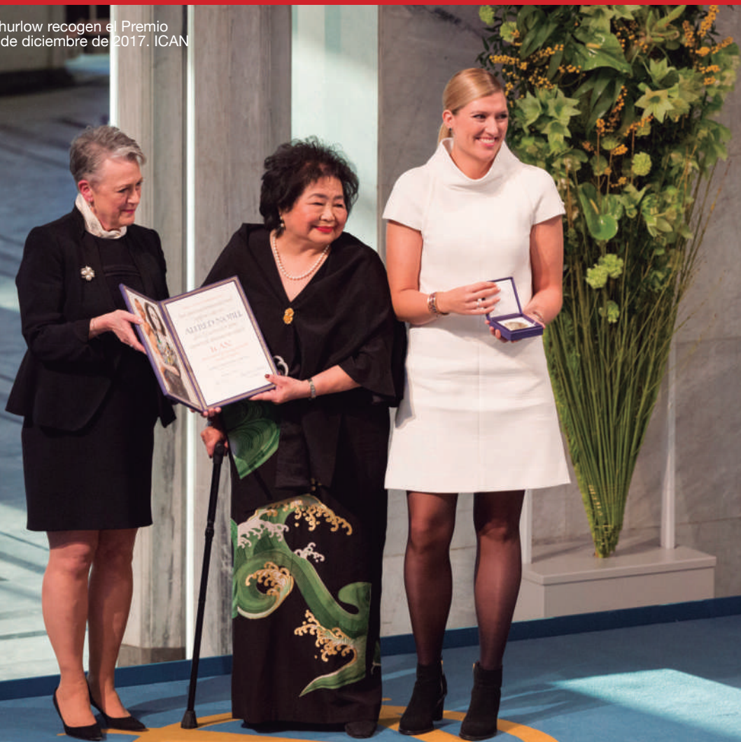
Beatrice Fihn y Setsuko Thurlow recogen el Premio Nobel de la Paz. Oslo, 10 de diciembre de 2017. ICAN

El premio ilumina el camino hacia un mundo sin armas nucleares y potenciará el mensaje de la ICAN mientras trabaja con tesón en los próximos años para garantizar la plena aplicación de este histórico nuevo acuerdo. Cualquier país que quiera un mundo más pacífico, por siempre libre de la amenaza nuclear, firmará y ratificará el tratado sin demora.