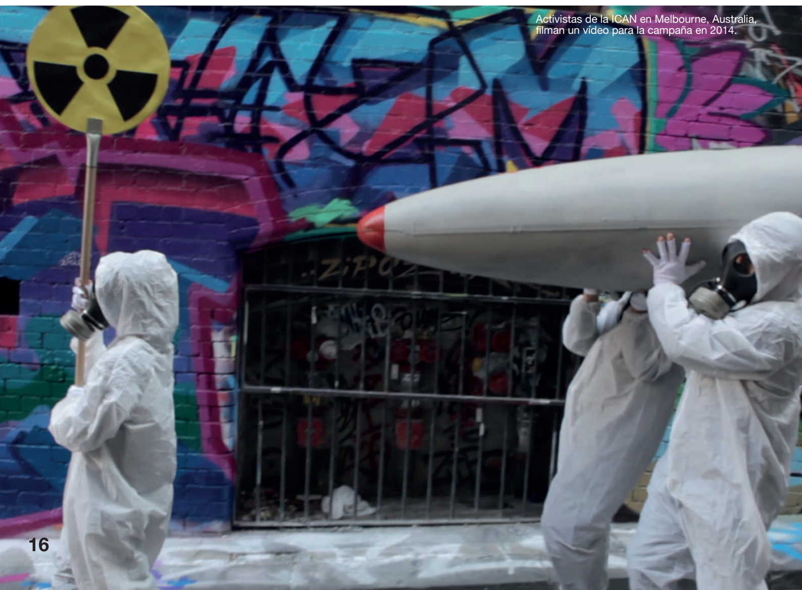
Activistas de la ICAN en Melbourne, Australia, filman un vídeo para la campaña en 2014.