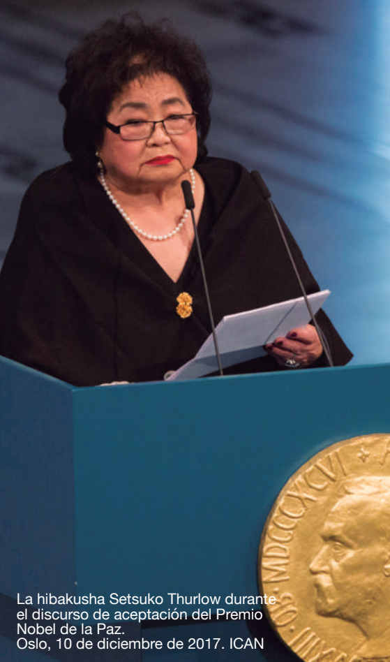
La hibakusha Setsuko Thurlow durante el discurso de aceptación del Premio Nobel de la Paz. Oslo, 10 de diciembre de 2017. ICAN

“DIRIGENTES DE LOS PAÍSES DEL MUNDO ENTERO, OS LO SUPLICO: SI AMÁIS ESTE PLANETA, FIRMAD ESTE TRATADO.”