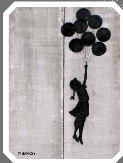
Il·lustració de portada: Carla Sánchez